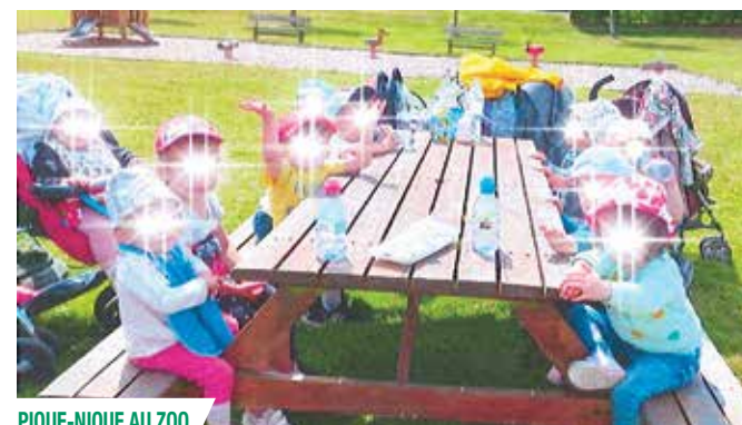
PIQUE-NIQUE AU ZOO