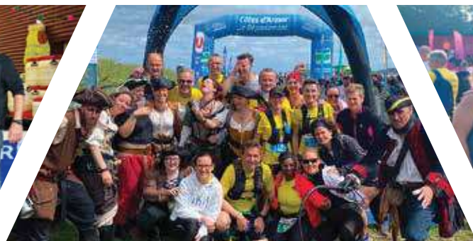
CAP À ST-DO Prêts pour le départ de la route du Fort