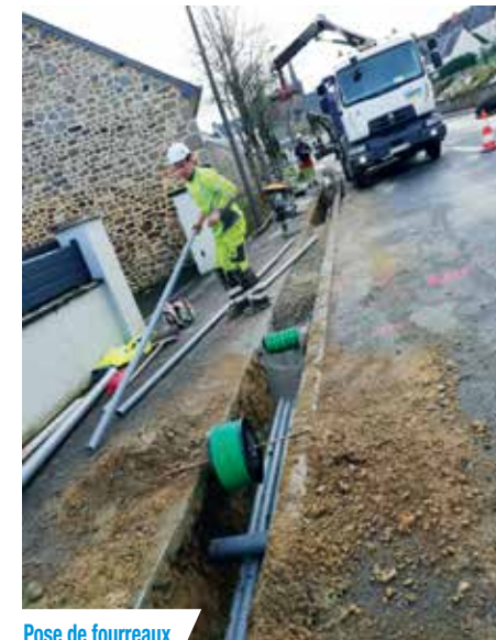
Pose de fourreaux

Les poteaux existants qui servent pour le téléphone sont parfois usés ou ne peuvent pas supporter le poids d'un câble supplémentaire. Dans ce cas il faut renforcer ou remplacer le poteau par un nouveau.