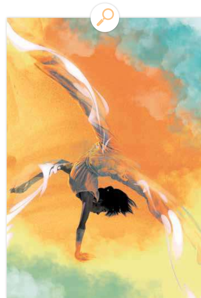
Avec le soutien de la Région Bretagne, la Délégation Régionale Académique à la Jeunesse, à l'Engagement et aux Sports de Bretagne, le Département d'Ille et Vilaine, la Communauté de communes de Bretagne romantique, la commune de Saint-Domineuc, la Ville de Rennes et la FFDanse - PSF.

Site internet : https://cieladainha.fr/ Email : cieladainha@gmail.com