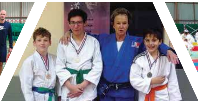
JUDO CLUB L'interclubs organisé par le Judo club de St-Domineuc