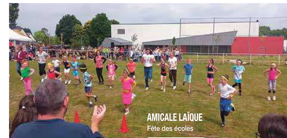
AMICALE LAÏQUE Fête des écoles