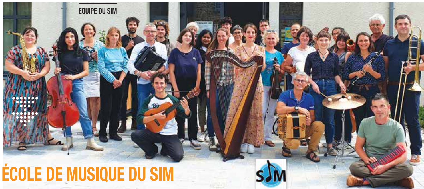
EQUIPE DU SIM