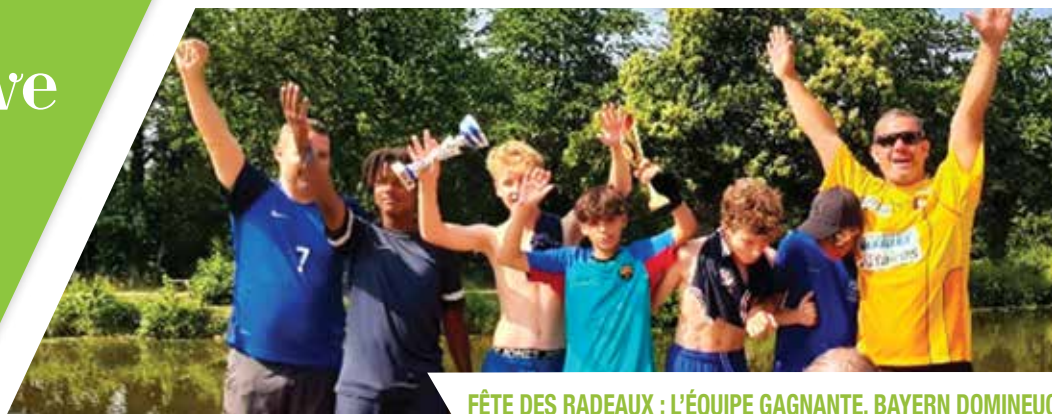
FÊTE DES RADEAUX : L'ÉQUIPE GAGNANTE, BAYERN DOMINEUC