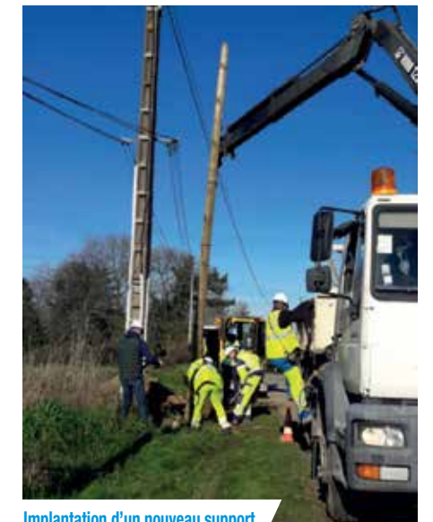
Implantation d'un nouveau support