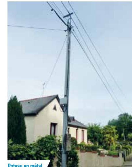
Poteau en métal